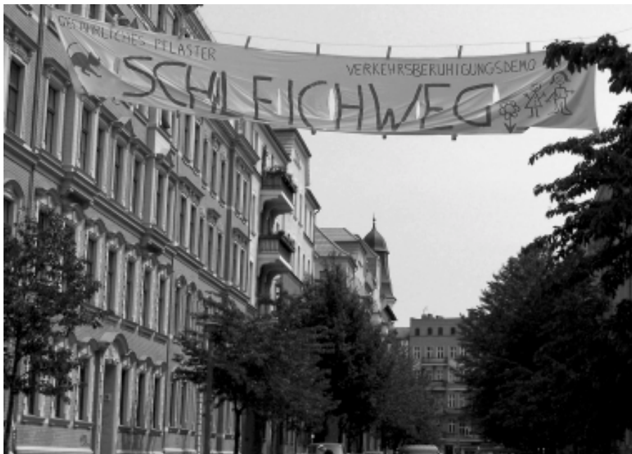
Anwohner der Bremer Höhe protestieren gegen den Schleichverkehr in ihrem Quartier unweit des Helmholtzplatzes.

Schönhauser Allee stadteinwärts und in der Danziger Straße vor dem Knotenpunkt Eberswalder/Danziger Straße in Richtung Westen, nimmt der Durchgangsverkehr durch die »Bremer Höhe« in beiden Richtungen erheblich zu. In der Greifenhagener Straße befinden sich eine Grundschule und eine KiTa. Die relativ hohen